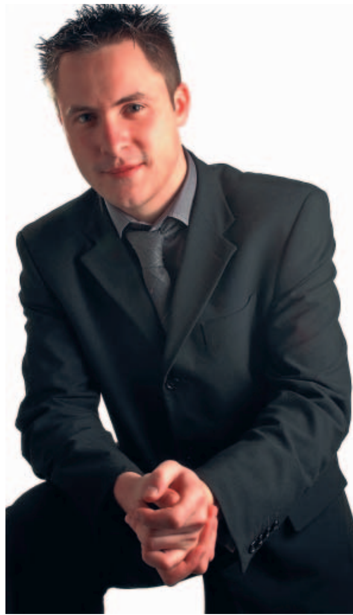
Surdoué de l'Internet, il porte aussi le costume du jeune patron. ■ E.B.

À NOTER Infos: 081/40.23.46. ou info@e-net-b.be