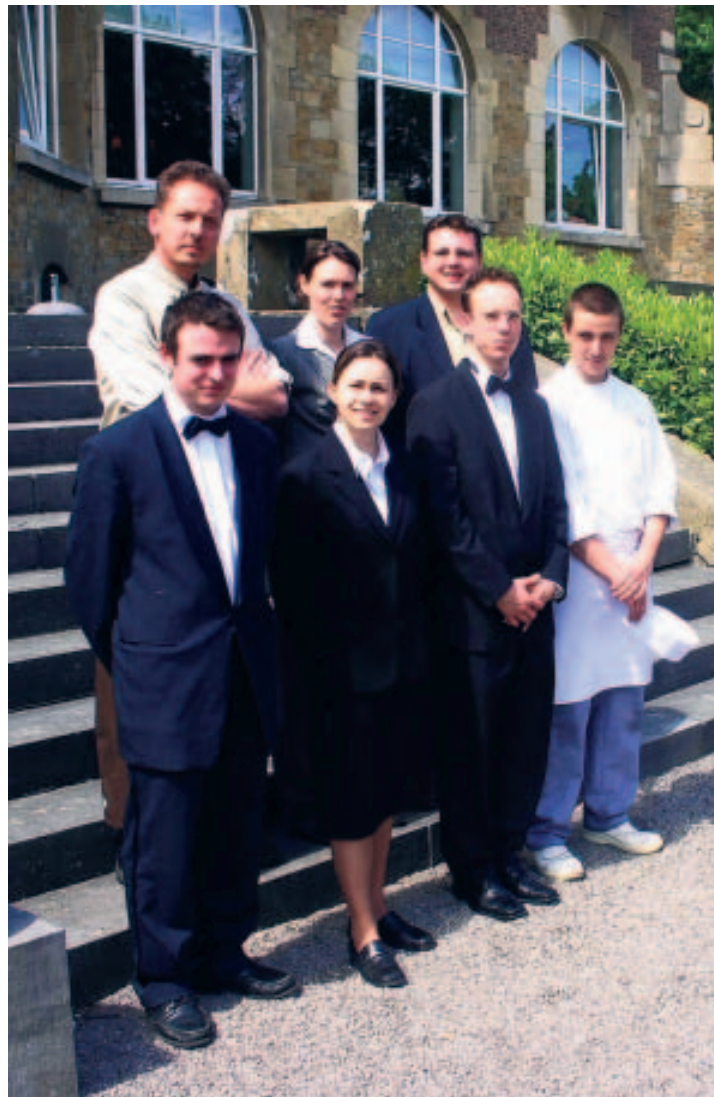
Ils sont prêts à vous servir. ■ V.M.

À NOTER Le "Château de Namur": Avenue de l'Ermitage, 1 à Namur - Tél.: 081/72.99.00. "L'Escale": Domaine Provincial de Chevetogne à Chevetogne - 083/66.82.62.